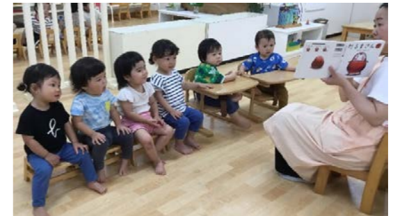
絵本を椅子に座って見るすることができます

子どもたちは、園の中での生活を繰り返すことにより、家庭でも身につけていくもの、良い生活習慣が整っていくように努めていきます。環境の中で生活を繰り返すことにより、家庭でも身につけていくもの、良い生活習慣が整っていくように努めていきます。