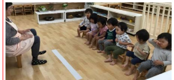
先生のお話を静かに聞くことができます