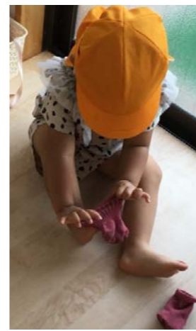
靴下を履けるまで頑張ることができます