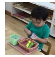
お仕事が終わってごみを捨てます

あれだけあわただしかった新学期も落ち着いてきました。5月になってお母さまと離れた後も徐々に泣かなくなり、自分から好きなお仕事を見つけて楽しんでいる姿が見られるようになりました。また身支度など、順序立てての生活にも自分で動くことができるようになってきています。 これから梅雨の季節に入りますが、雨、紫陽花、かたつむりなど、季節の自然を子どもたちと一緒に楽しんでいきたいと思ひます。