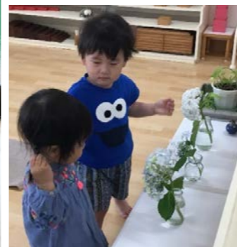
お花を優しく見るすることができます