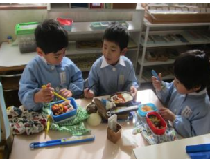
おしゃべりに華が咲いている3人