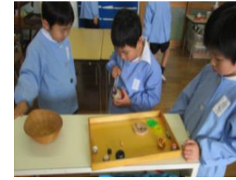
どの駒が一番回ると思う？