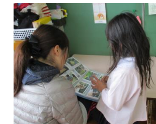
作品展にむけて先生と相談中！