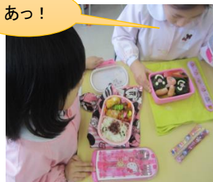
お弁当の蓋を開けてびっくり！

「はやく食べたいのに、きつくて解けないよ！」悪戦苦闘している〇さんの様子を見て「手伝ってあげる大丈夫」